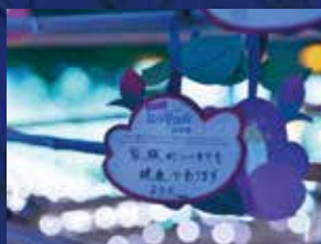
願いの花たんざく

●光の演出 ●なら瑠璃絵オフィシャルブース ●マーケットブース ●十津川温泉足湯 ●奈良公園バースデー花火